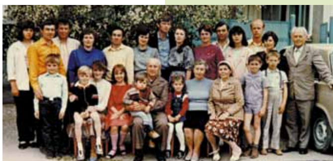
Russlanddeutsche Familien sind ein demografischer Gewinn für Deutschland.

Aus den Erfahrungen der Geschichte lässt sich die Zukunft positiv gestalten.