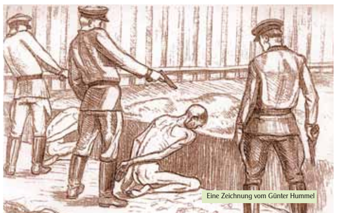
Eine Zeichnung vom Günter Hummel