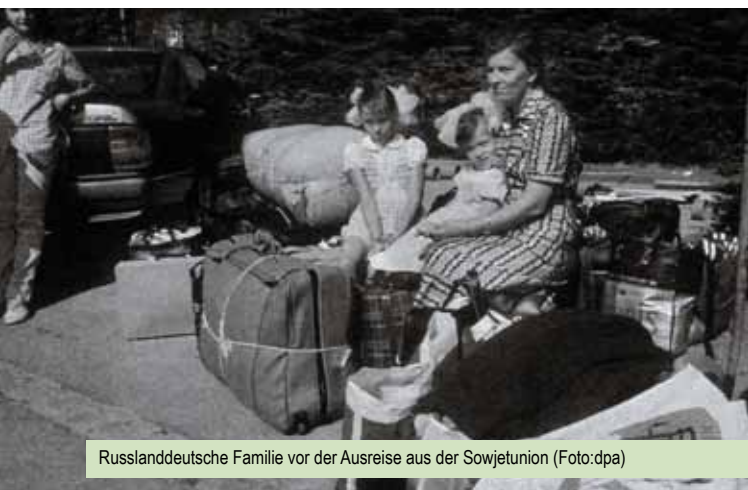
Russlanddeutsche Familie vor der Ausreise aus der Sowjetunion

Wer das Schicksal und das erlittene Unrecht der Russlanddeutschen kennt, denkt anders über die Spätaussiedler.