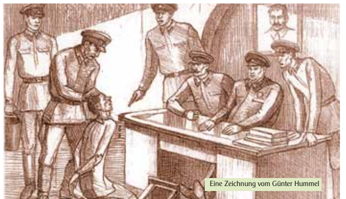
Eine Zeichnung vom Günter Hummel

Die Erlasse in damaliger Zeit : „Alle Deutsche in Rüstungsbetrieben, Halbrüstungsbetrieben, und in den chemischen Werken, in Kraftwerken und im Bau in allen Gebieten, alle verhaften!“ weisen auf eine Nationalistische Einstellung der Regierung hin.