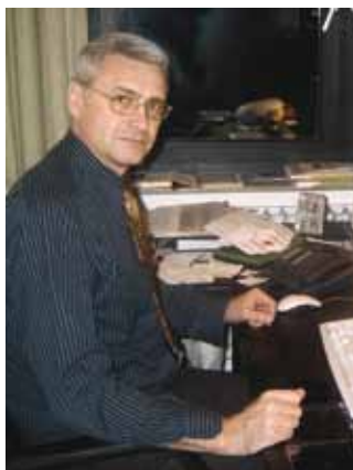
220.000 Deutsche aus Russland sind mit einer akademischen Bildung in die Bundesrepublik Deutschland gekommen. Ein nicht zu unterschätzendes Potenzial für die Wirtschaft.

Hier eröffnet sich für die deutsche Wirtschaft ein wahres Potenzial an wertvoller akademischer Intelligenz, wenn man in zusätzliche Qualifizierungsmaßnahmen investiert. Die Zukunft unseres Landes wird auch durch das geistige