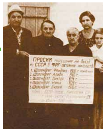
Auf unterschiedliche Wegen haben die Russlanddeutsche Deutschland über die Ausreiseabsicht informiert

Deshalb war es von Interesse, dass die Volkszählung von 1959 feststellte, dass 1.615.000 Deutsche in der UdSSR lebten. Allerdings blieb geheim, wie sich diese Zahl auf die einzelnen Sowjetrepubliken verteilte.