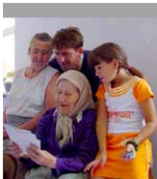
Die Nachrichten aus Deutschland liest man in Russland mit der ganzen Familie. Wie lebten sich die Verwandten ein, welche Probleme oder auch Erfolge haben sie in dem fremden Vaterland.

„Ihr Engagement für die Bildung ihrer Kinder ist vorbildlich.“ betonte er.