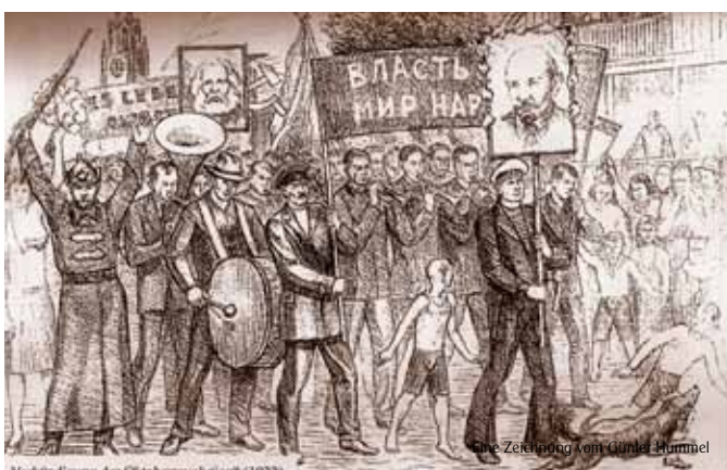
„Verkündigung der Oktoberrevolution“ (1922)