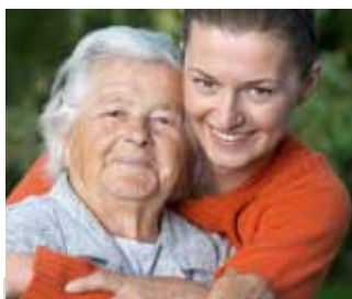
Das erste Treffen im Übergangslager Friedland. Die Russlanddeutschen bekamen bessere Ausreisemöglichkeit nach dem das Gorbatschow Regierungschef wurde.

Natürlich werden der größte Wille und die beste Qualifikation bei Problemen mit der deutschen Sprache