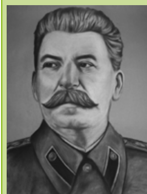
Joseph Stalin war ein sowjetischer Politiker und Diktator.

Seit 1922 war er Generalsekretär des Zentralkomitees der Kommunistischen Partei der Sowjetunion (KPdSU), seit 1941 Vorsitzender des Rates der Volkskommissare, seit 1946 Vorsitzender des Ministerrats der UdSSR und in den Jahren 1941 bis 1945 Oberster Befehlshaber der Roten Armee – der „Generalissimus“. Nachdem er sich im Machtkampf innerhalb der KPdSU durchgesetzt hatte, behielt er diese Ämter bis zu seinem Tod.