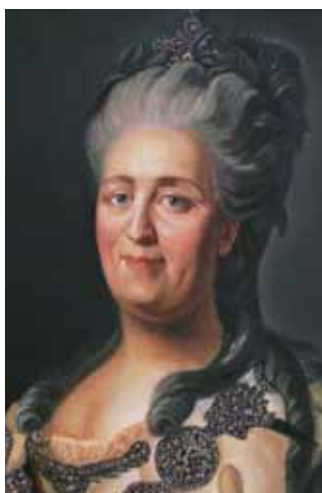
Die aus Deutschland stammende Katharina II. (1762-1796) vertrat wie Friedrich II. in Preußen, Maria Theresia und Joseph II. in Österreich einen aufgeklärten Absolutismus und förderte wie diese die Kolonisation von innerstaatlichen, kaum oder unbewohnten Gebieten, um so ein erhöhtes Bevölkerungswachstum zu erreichen.