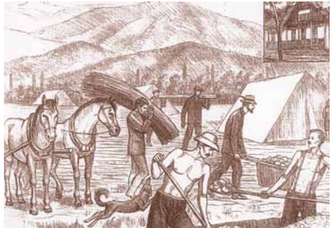
Eine Zeichnung vom Günter Hummel

Die besseren Bedingungen führten - gepaart mit modernem landwirtschaftlichem Gerät - zu einer