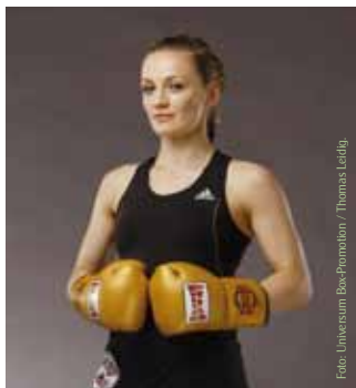
Ina Menzer WBC/WIBF- Doppelweltmeisterin im Federgewicht.

Eine bedeutende Rolle bei der Integration spielt der Sport, durch die Vielfalt der Möglichkeiten